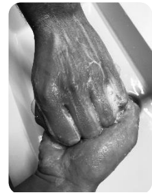
4 Doigts crochets