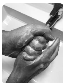
6 Autour et dessus des pouces