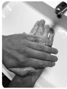
2 Dos de main