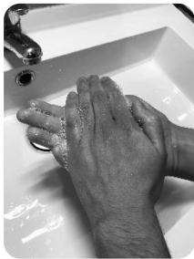
1 Paume de main