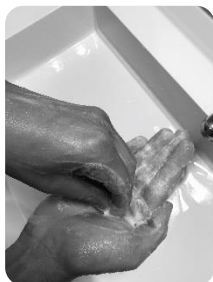
5 Pulpe des doigts