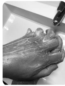
3 Espaces interdigitaux