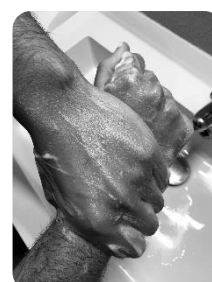
7 Autour des poignets

Pendant cette période, pensez à vous couper les ongles plus court (le virus peut se stocker sous les ongles ; endroit plus difficile à laver), mais aussi, à enlever le vernis et les bijoux.